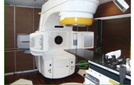
最新放射線治療装置「ノリスTX」導入

高エネルギーのX線を体の外から患部に照射し治療するもので、1日1回の治療を数週間行います。1回の治療は数分で終了し、痛みなどを感じることはありません。本院では今年最新の放射線治療装置の導入を予定しています。より低侵襲で高精度な治療をすることが可能となり、治療効果の向上と副作用の低減が期待されます。