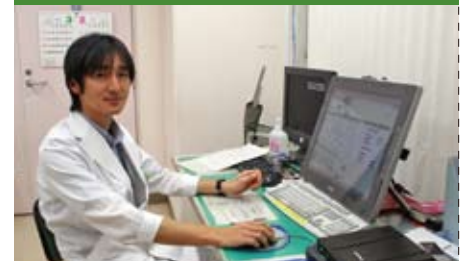
説明は 徳島大学病院 放射線治療科 副科長

高エネルギーのX線を体の外から患部に照射し治療するもので、1日1回の治療を数週間行います。1回の治療は数分で終了し、痛みなどを感じることはありません。本院では今年最新の放射線治療装置の導入を予定しています。より低侵襲で高精度な治療をすることが可能となり、治療効果の向上と副作用の低減が期待されます。