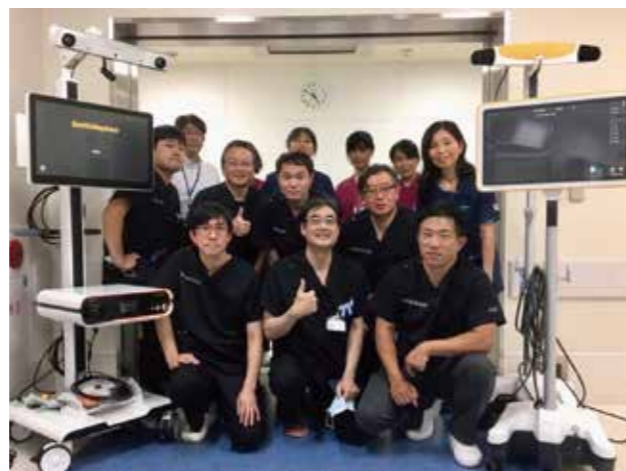
徳島県立三好病院 高度先進関節脊椎センターにて

徳島県西部は“四国のへそ”と呼ばれてきたように、香川県・愛媛県・高知県の3県と接し、医療圏も四国4県に跨っています。したがって徳島県西部(四国のへそ)の医療を充実させることは、徳島県内はもちろん四国全体の医療を充実させることに繋がると考えられます。またその取組みを県西部だけでなく県南部にも広げ、大学病院や関連施設と密に連携することで、重症患者の受け入れもスムーズに行い、安心した医療を提供できることを目指します。