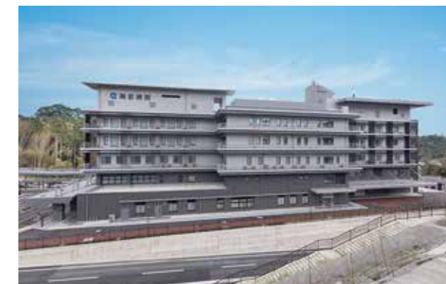
徳島県立海部病院