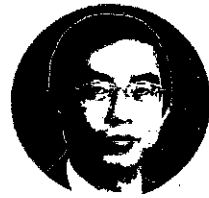
徳島大学病院歯科衛生室