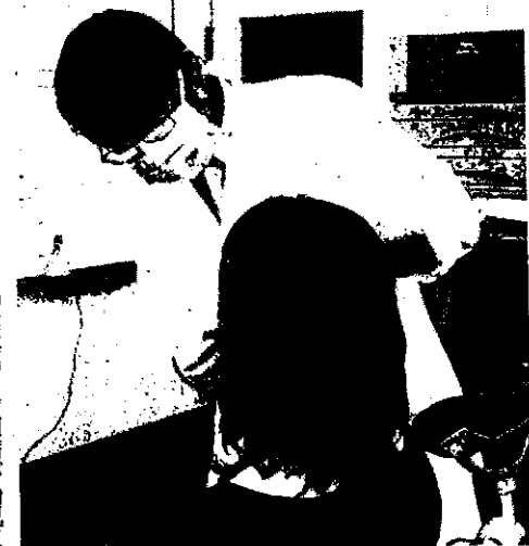
徳島大学病院での妊婦歯科健康診査