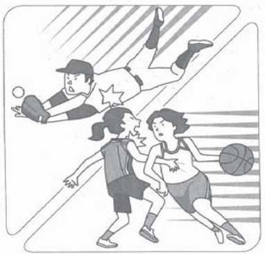
野球のタイムピッチャーは、軽い衝撃でも肩の骨が抜けることがある。